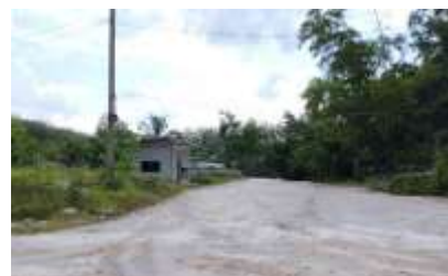
เส้นทางการคมนาคมเข้า-ออกพื้นที่โครงการ