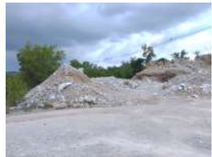
พื้นที่เก็บกองเปลือกดิน