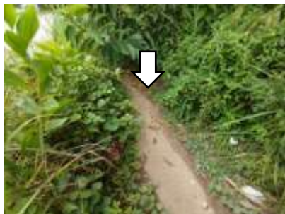
คูระบายน้ำ