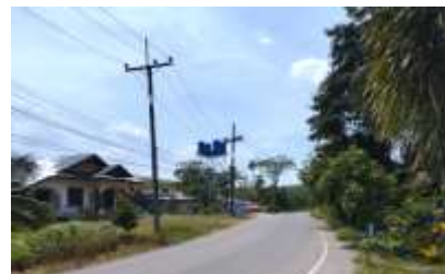
ทางหลวงหมายเลข 41