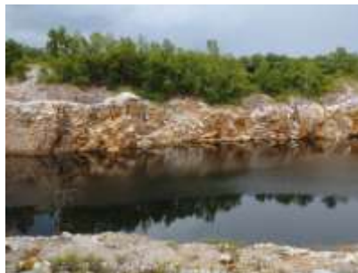
บ่อขุดเหมือง