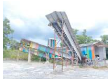
โรงแต่งแร่ของโครงการ