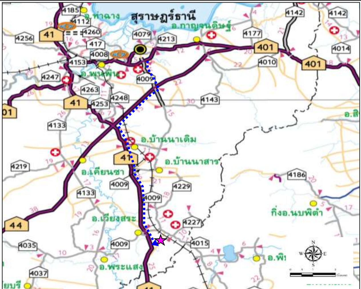
รูปที่ 1-3 แสดงการคมนาคมเข้าสู่พื้นที่โครงการ