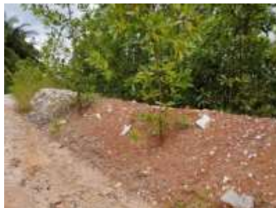
คันทำนบดิน