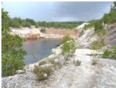
พื้นที่หน้าเหมือง